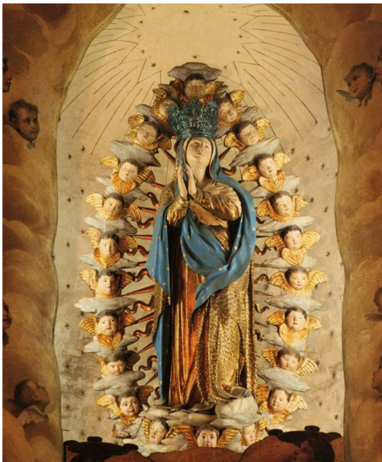
MADONNA DELL'ASSUNTA (G. CIBELLI, 1515), CATTEDRALE DI CARPI