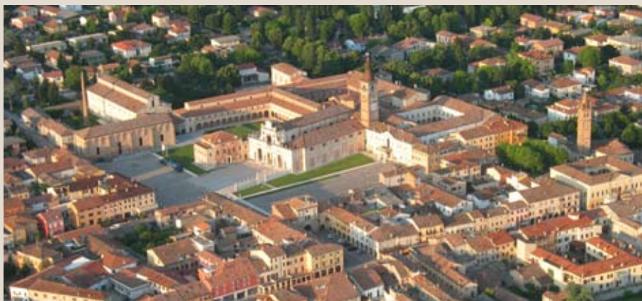
Polirone: veduta aerea del centro storico di San Benedetto Po